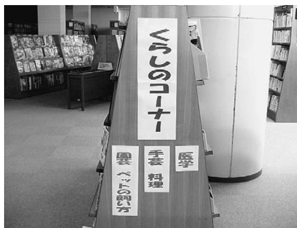
▲耐震補強・改修工事後の館内