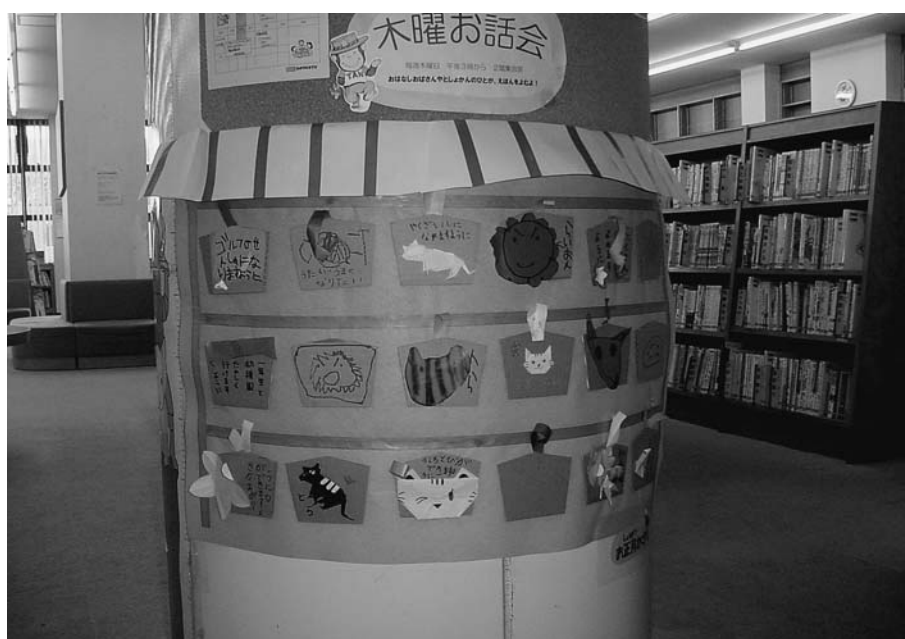
▲としょかんかざり隊！作品（お正月）